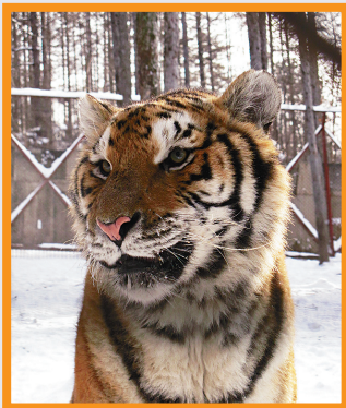
園內的東北虎，每頭都長得極為健康。

這個被譽為目前全世界最大東北虎繁殖基地的東北虎林園，便在距離度假村約一小時車程的海林市橫道河子鎮，虎園在1998年開業，佔地達十四萬平方米，內裏分為猛虎園、幼虎園、珍稀動物觀賞園、熊園及鹿園等八個區域，育有逾四百頭東北虎，其中約二百頭更是純種東北虎，極具保育及觀賞價值，難怪早被列為國家4A級景點。付過40元人民幣入場費及15元人民幣車費，我們便坐上小巴來到猛虎園，只見猛虎園設有兩道門，要待第一道門關妥，第二道門才會打開，確保猛虎不會越柙，看到我們的車子，這些可以自由走動的東北虎都以為是時候飽餐一頓，因為不少遊人都會乘時購買食物餵牠們，像活牛賣3,500元人民幣，活雞則為100元及150元人民幣，前者為地面撲擊價，後者卻是爬樹活捉價，可是大家都覺得太殘忍，沒有光顧。及後我們轉到養殖區隔着鐵絲網觀賞成年虎及幼虎時，才以每條10元人民幣的價格買來肉條餵牠們，算是對虎園的營運多作點支持吧！