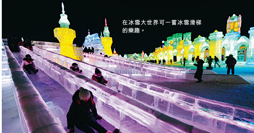
在冰雪大世界可一嘗冰雪滑梯的樂趣。

Club Med亞布力度假村的村外遊活動選擇不少，到訪東北虎園之外，中國雪鄉行程也是極受歡迎。這個雪鄉，是個距離Club Med亞布力度假村個多小時車程的小村莊，曾被中國版《國家地理》雜誌選為中國冬季最美麗的勝景之一，由於村莊一帶降雪量位列全國之冠，每到冬季，便可看到一個披上雪影銀妝的漂亮桃花源，遊人在此，更可玩到狗拉雪橇及雪地飛碟等玩意，只要湊夠四人便可出發，半天遊行程每人490元人民幣。