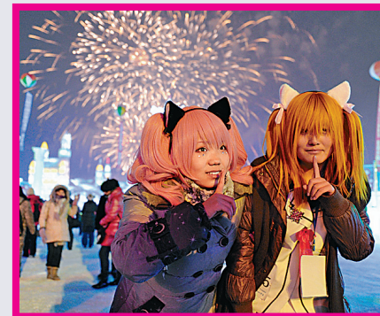
國冰雪動漫節，令會場上不時可見動漫美少女現身。