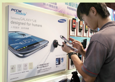
Lynda Gratton預計，到了2025年，超過50億人以流動通訊連繫。

最後一點，Lynda Gratton認為，職場新人類必須認真地思考：「你究竟想過怎樣的生活？做什麼工作？在回答這問題前，先充分了解自己的個性、專長及興趣。正向心理學研究亦顯示，人如果從事熱愛而且有意義的工作，就會享受到工作，產生忘我的心流效應。這種強烈的體驗，會為你帶來具價值的經驗，而不再如從前，工作為賺錢，青春變得一文不值。近五年間，越來越多年輕人表示，願意做一些低薪的散工或兼職，捨棄物質生活，工作不為掙錢，只為追求理想。