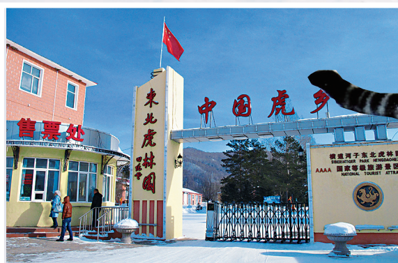
進園參觀的遊人都可隔着鐵絲網近距離觀看及餵飼東北虎。