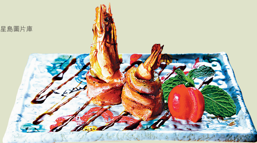
煙肉海鮮卷 除了蝦，還包着蠔、蘆筍和三文魚。

香港供應的串燒，很多都已突破日式、川式或京式做法，取而代之是自創新口味，像不甘平凡的川燒，特別喜歡將食材左配右搭，自製墨魚八爪魚棒、煙肉海鮮卷、太極牛肉卷，連芝士餅、湯丸也愛燒一燒。不知這種港式串燒是否合你胃口，但就深得名人紅星歡迎。