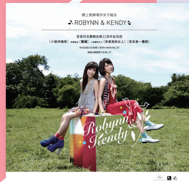
同名大碟《Robynn & Kendy》